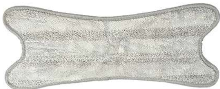
Сменная насадка для швабры X-TWIST Арт. 74813