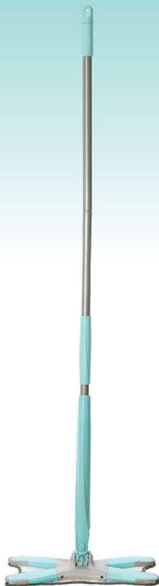
Швабра для пола X-TWIST Арт. 74812